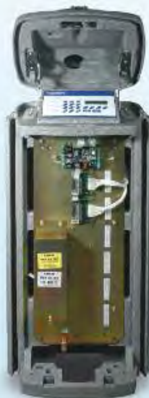
Piédestal plastique en vue de face avec 32 stations(2 modules type C x 16 stations par module = 32)