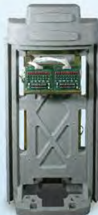
Piédestal plastique en vue dos (Représentant les connexions pour le câblage des voies)