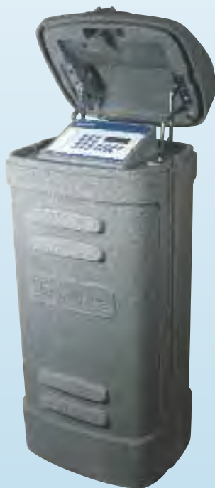
Boîtier piédestal plastique