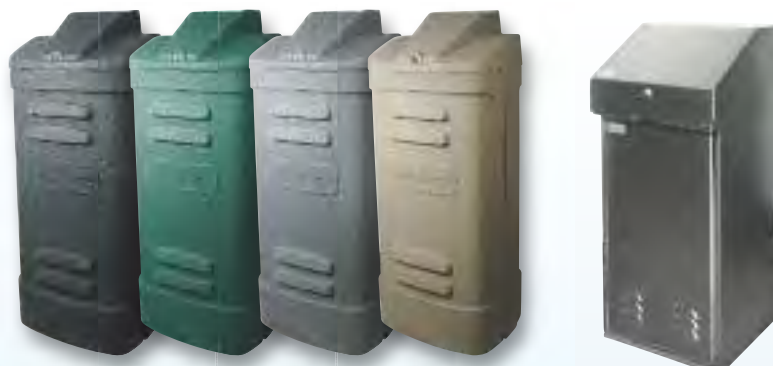
Options couleur piédestal plastique