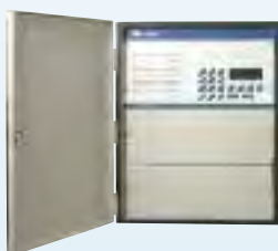
Boîtier montage mural